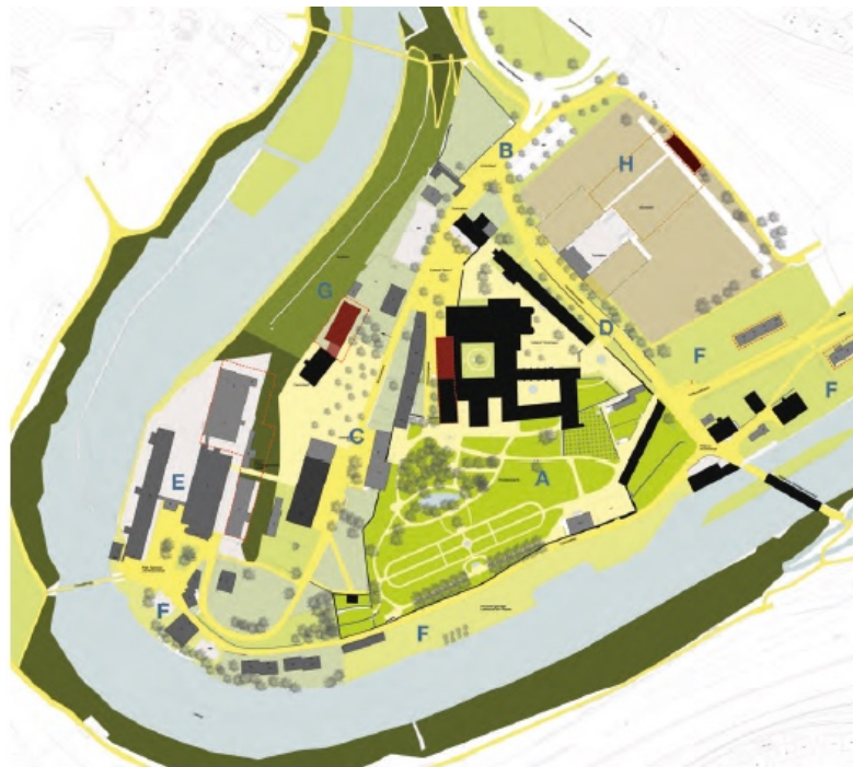
Abb. 1: Städtebaulicher Leitplan (aus Masterplan 2013)

Der städtebauliche Leitplan als Teil des Masterplans zeichnet ein Gesamtbild der gewünschten Entwicklung auf der Klosterhalbinsel. Angestrebt wird die ungeschmälerte Erhaltung der Klosteranlage und der industrie- und baugeschichtlich wertvollen weiteren Areale. Ein besonderes Augenmerk wird auf das Freiraumsystem gelegt.