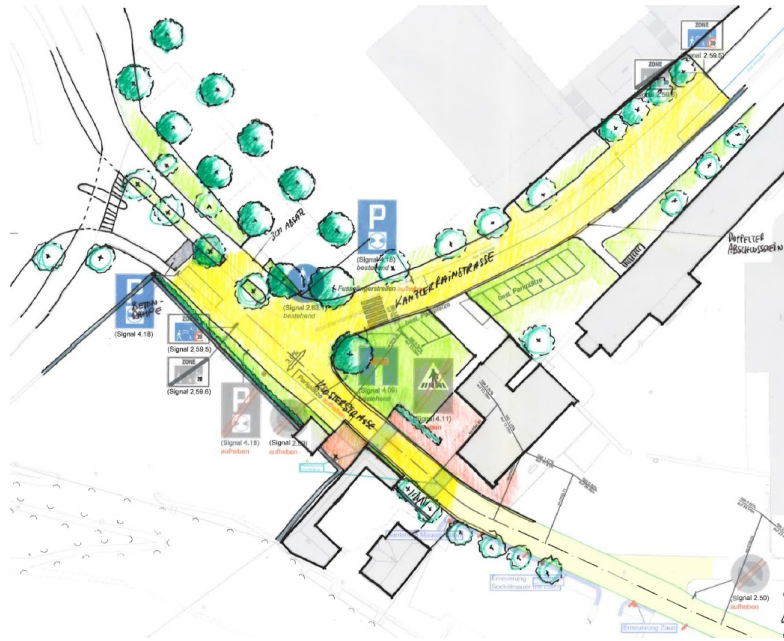
Abb. 3: Gestaltungskonzept für den Eingangsbereich zur Klosteranlage mit Klosterstrasse und Kanzlerstrasse; Bau- und Planungsabteilung Wettingen; 8. Oktober 2018

jekt wurde durch die Bau- und Planungsabteilung Wettingen erarbeitet. Auf der Klosterstrasse wird die Begegnungszone im Frühjahr 2020 eingeführt. Der Knotenpunkt Kloster-/Kanzlerstrasse wird mit dem nächsten ordentlichen Sanierungsintervall umgesetzt.